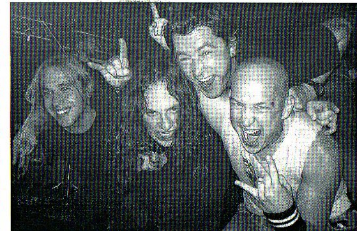
Laut und heftig soll er werden, der Auftritt der Crash Kidz bei der Band-Challenge-Night am Samstag.

Erst ein Jahr alt ist die Band Rambles aus Schweinfurt, deren vier Musiker sich dem typischen Bad-Ass Rock'n Roll verschrieben haben. Auch hier ist amtliche Gitarrenarbeit angesagt.