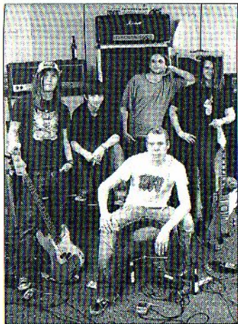
Black Rabbit wollen es in Fahr ordentlich rocken lassen.

Gemeinsam mit dem Jugendhaus Volkach hat der Kreisjugending die regionale Musikszene in den vergangenen Monaten aufgerufen, sich für die 4. Band-Challenge-Night zu bewerben. Unter professionellen Bedingungen und vor einem größeren Publikum treten in der FC-Halle in Fahr jetzt auf: die Crash Kidz , Cheap Thrills , Rambles , Black Rabbit